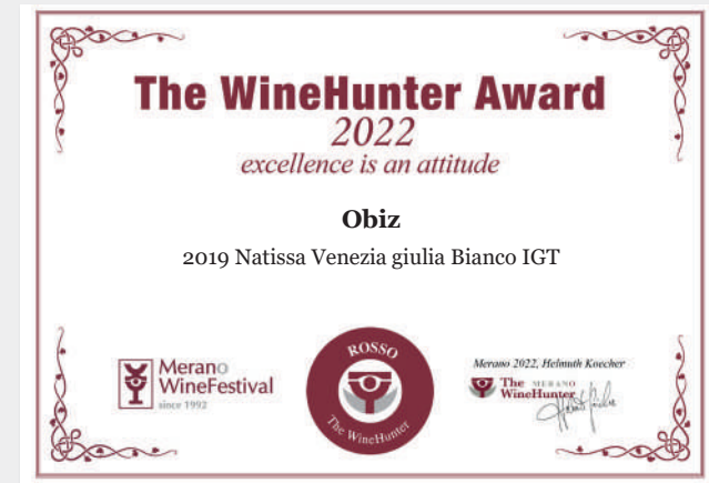
2019 NATISSA VENEZIA GIULIA BIANCO IGT