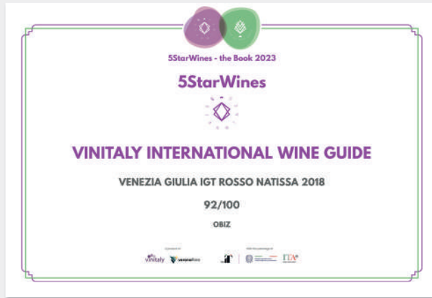
NATISSA ROSSO IGT VENEZIA GIULIA 2018